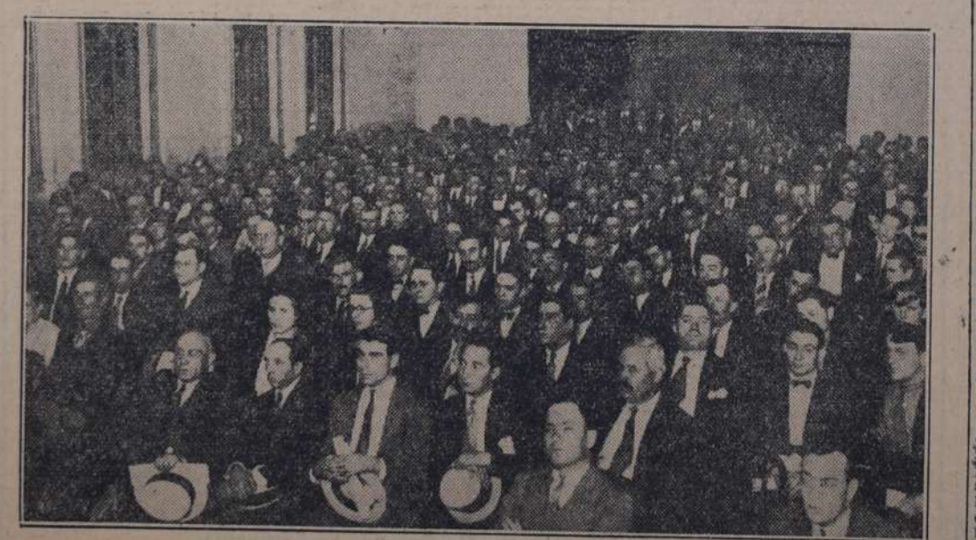
La concurrencia durante el mitin de anoche